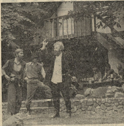
EINE SZENE aus dem „Schinderhannes“ auf der Freilichtbühne Lohne.

„Ein Sommernachtstraum“ auf der shakespearegeeigneten Freilichtbühne Bentheim; das Mundartstück „De vergnögte Tankstelle“ in Meppen; Zuckmayers Volksstück „Schinderhannes“ in der Jubiläumsfreilichtbühne Lohne, die Anfang Juli ihr 25-jähriges Bestehen feiern konnte, und schließlich noch die Goldoni-Komödie „Die Zwillinge aus Venedig“ in Barsinghausen. Die Mundartbühnen Wagenfeld und Hottelbühl haben ihre Spielzeiten bereits nach sehr gutem Publikumszuspruch beendet. Mundart, und das zeigt sich gerade auch auf den Freilichtbühnen, findet wieder mehr Interesse.