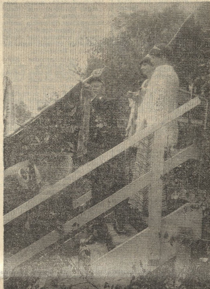
DER AUSTAUSCH von Fahnenägeln und Erinnerungsbändern darf auf keinem Jubelschützenfest fehlen.

Lingen. - Die Mütterberatung durch das Staatliche Gesundheitsamt am Schulplatz fällt im Monat August aus.